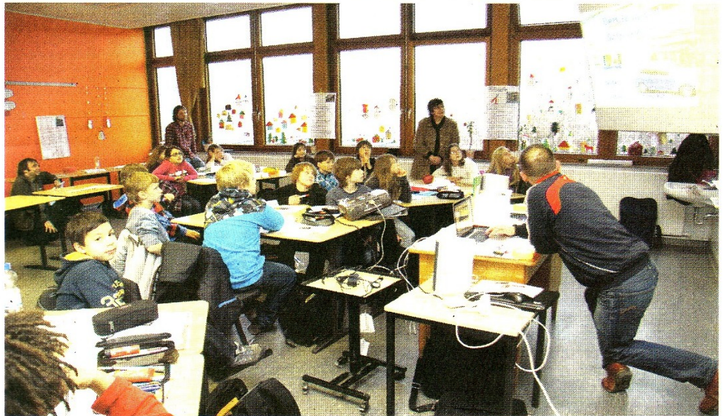
Gebannt verfolgen die Fünftklässler den Film über die Berufe in Bad Salzdettfurth.